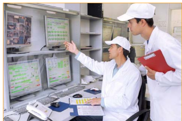
④ Ausbildung im Leitstand einer modernen Mühle