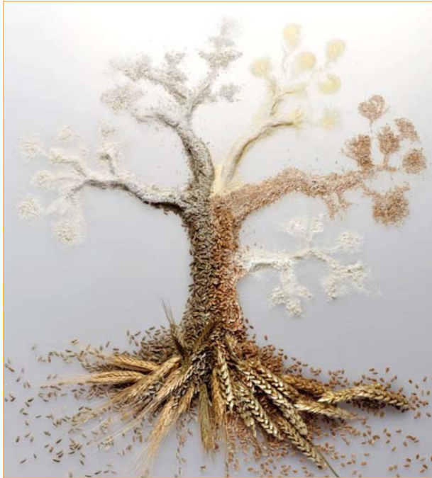
① Ein „Baum des Lebens“ mit Brotgetreide und Mahlerzeugnissen (links Roggen, rechts Weizen)

Diese Bilder von unserem Messestand (Nr. 1-3) sowie zwei weitere Illustrationen zu den Presstexten können Sie als JPEG-Dateien mit 300 dpi unter Angabe der Kennziffer per E-Mail abrufen: vdm@muehlen.org