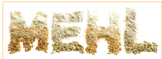
③ Körner, Schrote und Mehle Vielfältige Mahlerzeugnisse werden regional aus Weizen und Roggen hergestellt