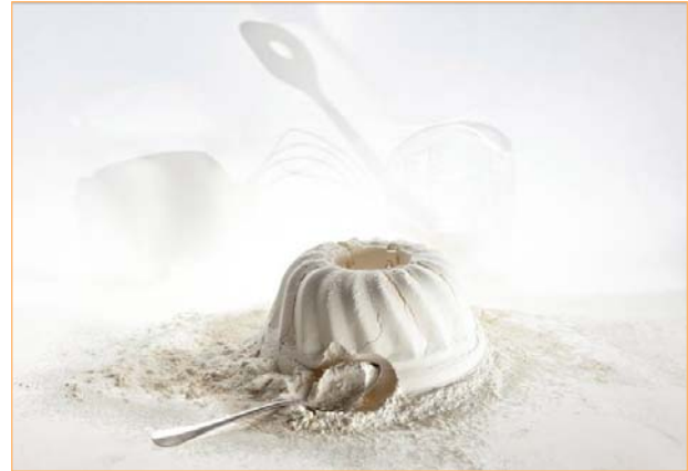
② Ohne Mehl ist nichts gebacken! Mühlen liefern die Grundlage für Produkt- und Nährstoffvielfalt